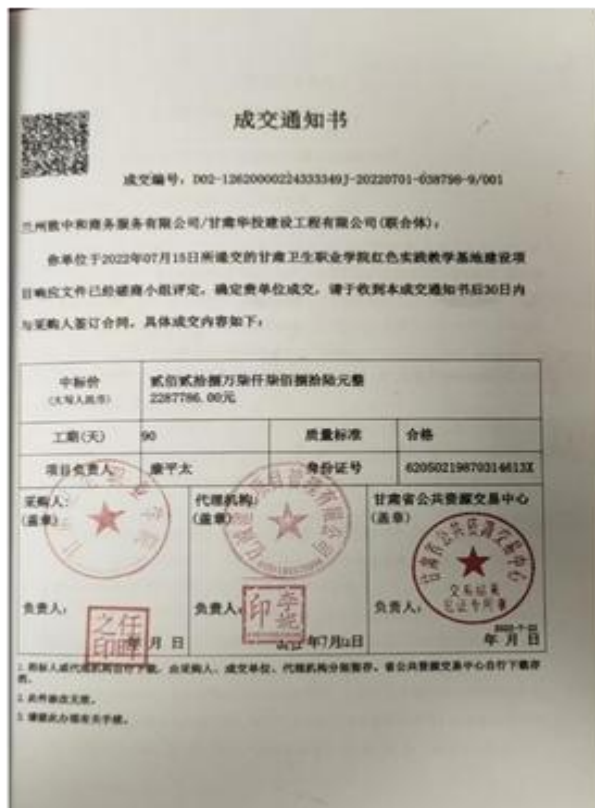
甘肃卫生职业学院红色文化实践基地建设项目合同书