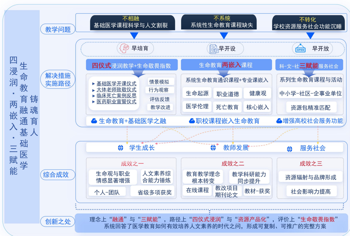
图2 解决问题的方法与路径

针对上述问题，本成果以社会学习理论、人本主义教育理论及高校第三职能理论为指导，进行系统化改革与实践，形成了以下解决路径（见图2）：