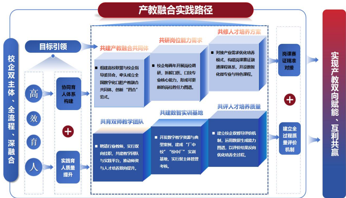
图 3 产教融合实践路径图

3. 多举措强化德能协同培育：一是结合口医、口技的岗位特点，制定差异化素养培育目标，口医聚焦“医者仁心”，将医患沟通、医疗伦理、人文关怀、基层服务意识作为培育重点；口技侧重“工匠精神”培育，将职业诚信、工艺严谨、精益求精、质量把控作为核心内容。二是创新思政元素融入路径，实现专业教学与思政教育同频共振，将思政元素嵌入教学、实训、实习等各个环节。三是通过举办“医者仁心”主题论坛、口腔行业工匠精神评选等活动，让学生近距离感受口腔行业的职业精神与价值追求，打造口腔特色校园文化，营造德技并修的育人氛围（图 4）。